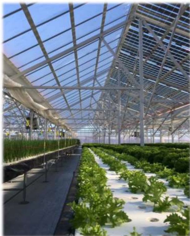
ソーラーファーム写真

太陽光発電システムは、再生可能エネルギー固定買取価格制度（FIT）によって急速に普及拡大して参りましたが、一方、平成29年の改正FIT法の施行に伴い、全国各地で新しいビジネスモデルへの画期的な挑戦が始まっております。