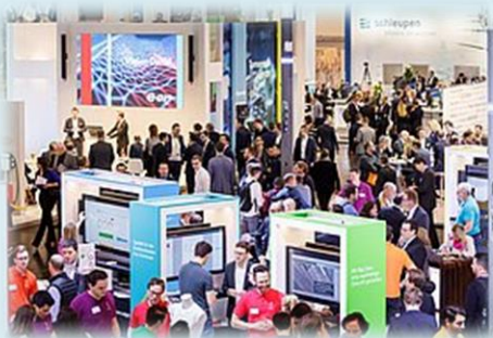
E-world2109 展示会場風景 ※公式HPより